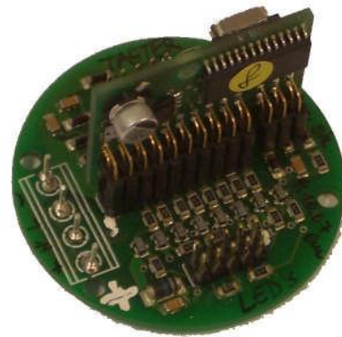
CAN Basis 3 – UPD2